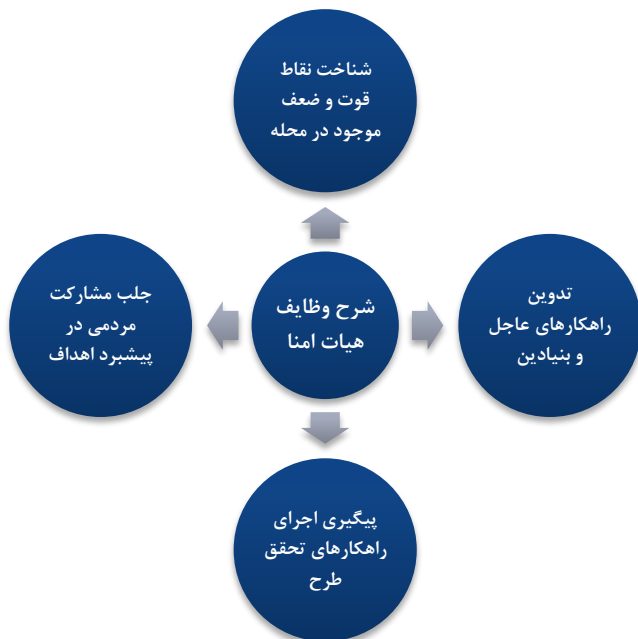
شکل شماره ۲: شرح وظایف هیات امنا

خانه های محلات در شهر شیراز به صورت مدلی از مدیریت هماهنگ و یکپارچه شهری اداره می شوند. بدین صورت که با تاسیس خانه محلات ، هیات امنای محله نیز تشکیل گردیده که اعضای اصلی آن به قرار زیر می باشند :