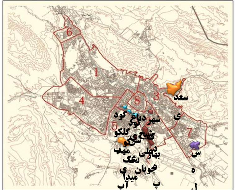
شکل شماره ۱: موقعیت پهنه های اسکان غیررسمی

تعداد ۱۰ محله از شهر شیراز از مجموع ۴۰ پهنه مورد مطالعه ، شناسایی گردید که شناسنامه محلات در جدول زیر ارائه شده است و موقعیت قرارگیری هریک در شهر شیراز در تصویر شماره ۱ مشخص شده است.