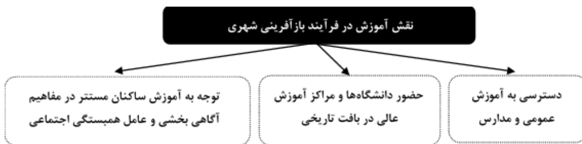
شکل ۱. دیدگاه‌های موجود درباب نقش آموزش در فرآیند بازآفرینی شهری

توجه به مقوله آموزش از سه دیدگاه استقرار واحدهای آموزش عالی، دسترسی به آموزش عمومی و اجرای آموزش‌های همگانی برای جلب مشارکت مردمی، در فرآیند بازآفرینی شهری تبیین گردیده‌است.